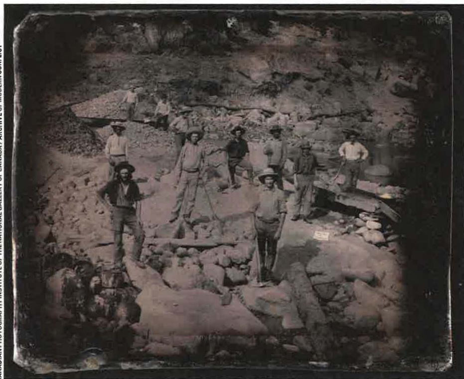
Goudmijnwerkers van Sterrett & Company, 1852, daguerreotype met kleur

Gold and Silver, tot 10 juni bij Foam in Amsterdam; foam.org